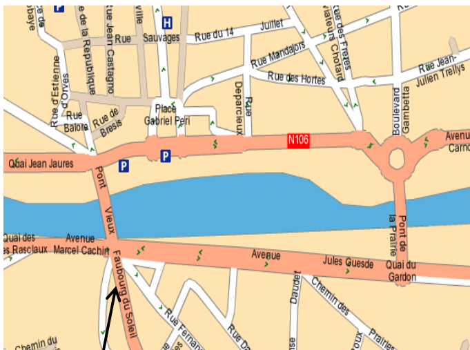
SAJE - 10, 8, 6 Faubourg du soleil